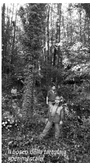
Il bosco della tartufoia sperimentale

Il bosco è stato ripulito a cura degli operai forestali della Regione Piemonte. E' visibile e facilmente raggiungibile dalla strada provinciale che percorre la valle BORBORE e collega il Roero con ALBA .