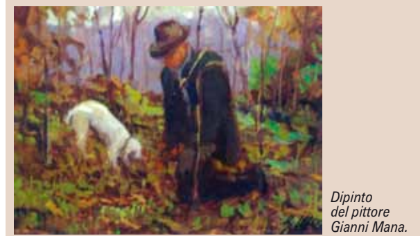
Dipinto del pittore Gianni Mana.

Magia di Natale in località Mombello.