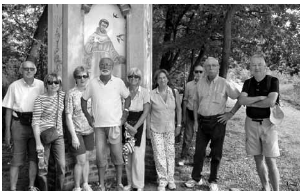
Nelle foto alcuni momenti delle passeggiate roerine.