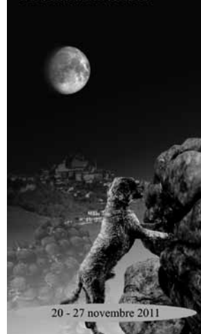
20 - 27 novembre 2011

XXXI FIERA REGIONALE DEL TARTUFO E DEI VINI DEL ROERO DI VEZZA D'ALBA