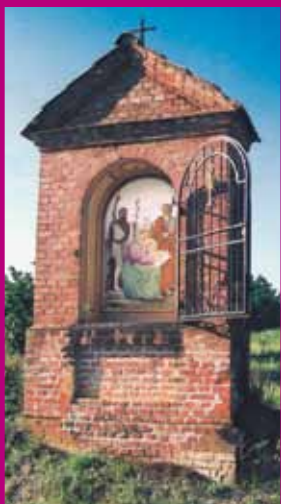
Monticello d'Alba Località La Valle.