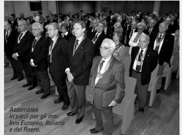
Assemblea in piedi per gli inni. Inni Europeo, Italiano e del Roero.

Sabato, 24 settembre 2011, presso il Centro Congressi della Fondazione "Roeroattiva" in piazzetta della Vecchia Segheria di Montà d'Alba, il nostro Ordine ha tenuto la sua annuale assemblea. Questo convegno, che rappresenta ogni anno il più importante momento ufficiale della vita dell'Ordine, è stato preceduto da alcune cerimonie altrettanto significative: una Messa solenne in suffragio dei cavalieri deceduti durante l'anno sociale; la consegna di 23 borse di studio ad altrettanti studenti del Roero segnalati come meritevoli dalle presidenze delle varie scuole superiori; la premiazione di 50 aziende vinicole "laureate" nell'undicesimo concorso enologico Vini del Roero.