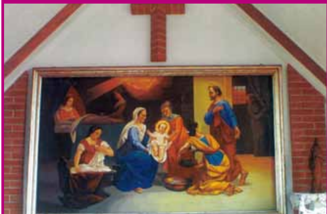
Priocca. La Sacra Famiglia.