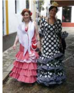
Continua a pag. 10

billas". Sabato, 24 aprile ci addentriamo nel cuore della pittoresca provincia di Cadice per gustare paesaggi e atmosfere della più genuina Andalusia: Arcos de La Frontera è città considerata tra le più