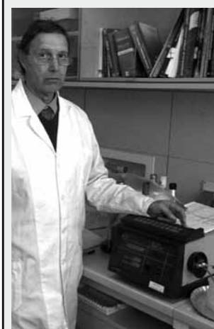
Particolare del dispositivo ad ultrasuoni "VWR Ultrasonic Cleaner"