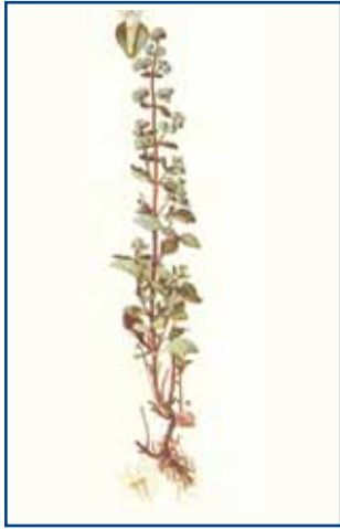
Maggiorana Origanum majorana

E' una pianta perenne, suffruticosa, alta 20-25 cm, angolosa e pubescente, con foglie opposte, piccole, ovate, intere. I fiori, molto piccoli, sono riuniti in spicasteri terminali, con corolla colore porpora o bianco. Il frutto è un tetrachenio. L'odore è aromatico, penetrante e gradevole. E' originaria dell'Asia centrale, Africa boreale ed Arabia. Coltivata negli orti, la troviamo inselvatichita nelle zone mediterranee e submontana. La parte attiva è costituita dalle porzioni erbacee della pianta, da cui si estrae l'essenza di maggiorana, che è un liquido giallo o giallo-verdastro che contiene terpineolo, borneolo, canfene e sabinene. La pianta contiene anche tannini, pentosani e un principio amaro. Ha un'azione antispasmodica che favorisce la digestione e calma i nervi. Possiede un notevole potere battericida. La maggio-